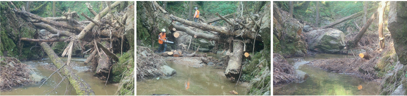
Démontage d'un embâcle sur la Tuilière par l'équipe rivières d'ARCHE Agglo

Enfin, certains participants se disent prêts à se mobiliser pour des actions d'entretien des cours d'eau, notamment en tant que propriétaires. ARCHE Agglo rappelle que réglementairement cet entretien incombe aux propriétaires riverains d'un cours d'eau.