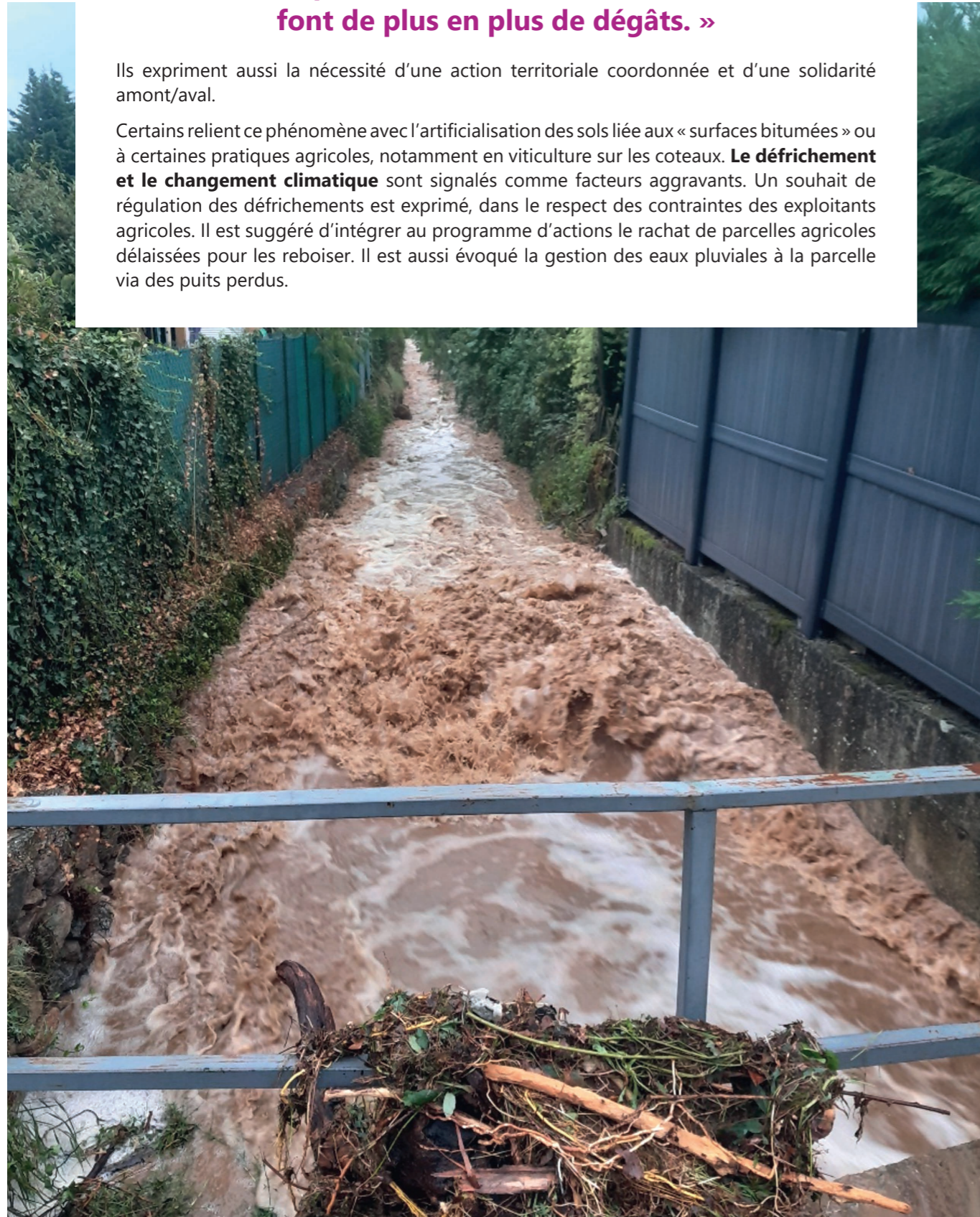
Le Gaizard à Vion en 2023

Certains relient ce phénomène avec l'artificialisation des sols liée aux « surfaces bitumées » ou à certaines pratiques agricoles, notamment en viticulture sur les coteaux. Le défrichement et le changement climatique sont signalés comme facteurs aggravants. Un souhait de régulation des défrichements est exprimé, dans le respect des contraintes des exploitants agricoles. Il est suggéré d'intégrer au programme d'actions le rachat de parcelles agricoles délaissées pour les reboiser. Il est aussi évoqué la gestion des eaux pluviales à la parcelle via des puits perdus.