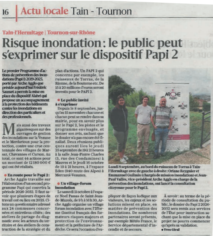
Articles du Daupiné des 8 et 11 septembre 2025

France Bleu a diffusé un spot de 2 minutes encore disponible au lien suivant : Territoire d’ARCHE Agglo : 15 à 20 millions d’euros d’investissements pour prévenir les inondations :