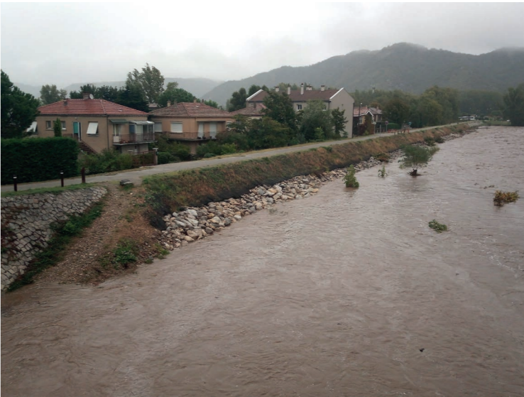
Digue du Doux à St Jean de Muzols lors de la crue de 2023

ARCHE Agglo prévoit des échanges sur ces sujets avec la CNR et précise que le classement d'un ouvrage en digue a des conséquences sur l'urbanisme à l'arrière de la digue. Une bande d'inconstructibilité pouvant aller jusqu'à 100 fois la hauteur d'eau retenue par la digue est instaurée. Une digue n'est donc envisagée que dans les secteurs où d'autres solutions seraient moins efficaces.