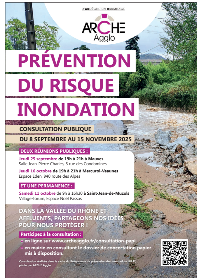
Affiche accrochée en mairie durant toute la durée de la concertation et page internet dédiée

400 flyers ont été distribués, notamment lors d'évènements comme le « Plouf » et le Festival territoire durable.