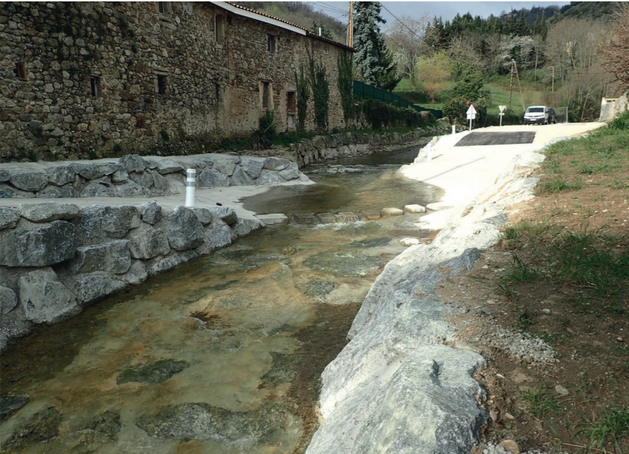
Réaménagement du passage à gué sur la Tuilière en 2024-2025 par ARCHE Agglo

Cette contribution alerte aussi sur le fait que la conception de ces franchissements devra tenir compte du projet de renaturation du Rhône et propose des modalités de gestion de projet adaptées au contexte, impliquant une concertation importante. ARCHE Agglo prévoit effectivement de la concertation sur ce projet.