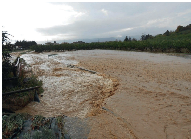
La Burge à Mercurol en 2013

La stratégie est très peu questionnée. Toutefois, le rythme d'avancement de la protection est noté par un participant : protection de 10% des enjeux lors du premier programme de 6 ans. Il mentionne comme une alternative à étudier le recul de l'urbanisation par des démolitions ou des déplacements d'activités et d'enjeux.