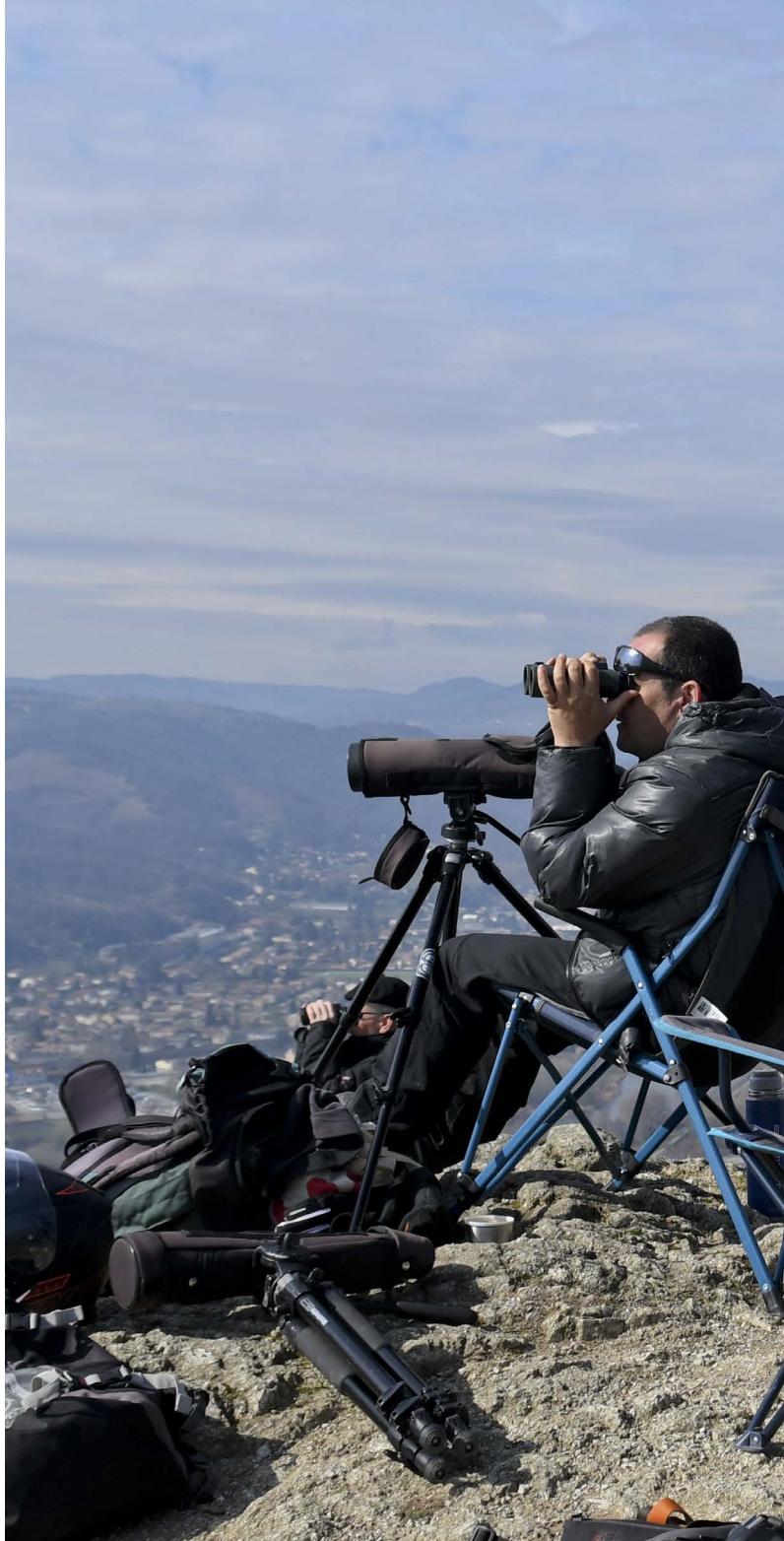
PIERRE AIGUILLE (CROZES-HERMITAGE), EN ATTENTE DES OISEAUX MIGRATEURS