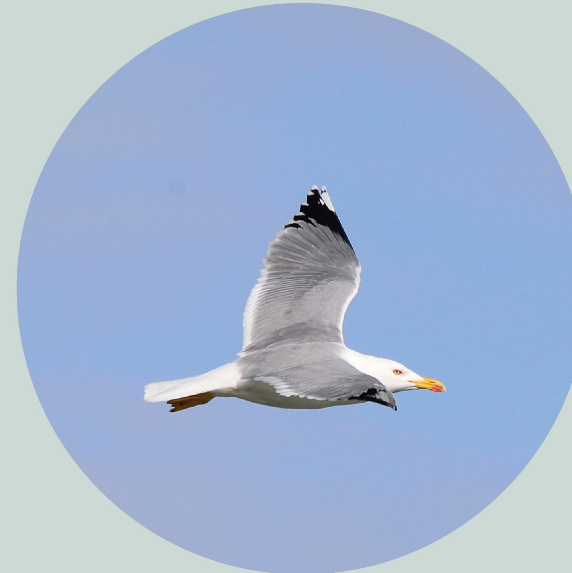
Goéland leucopnée Larus michahellis