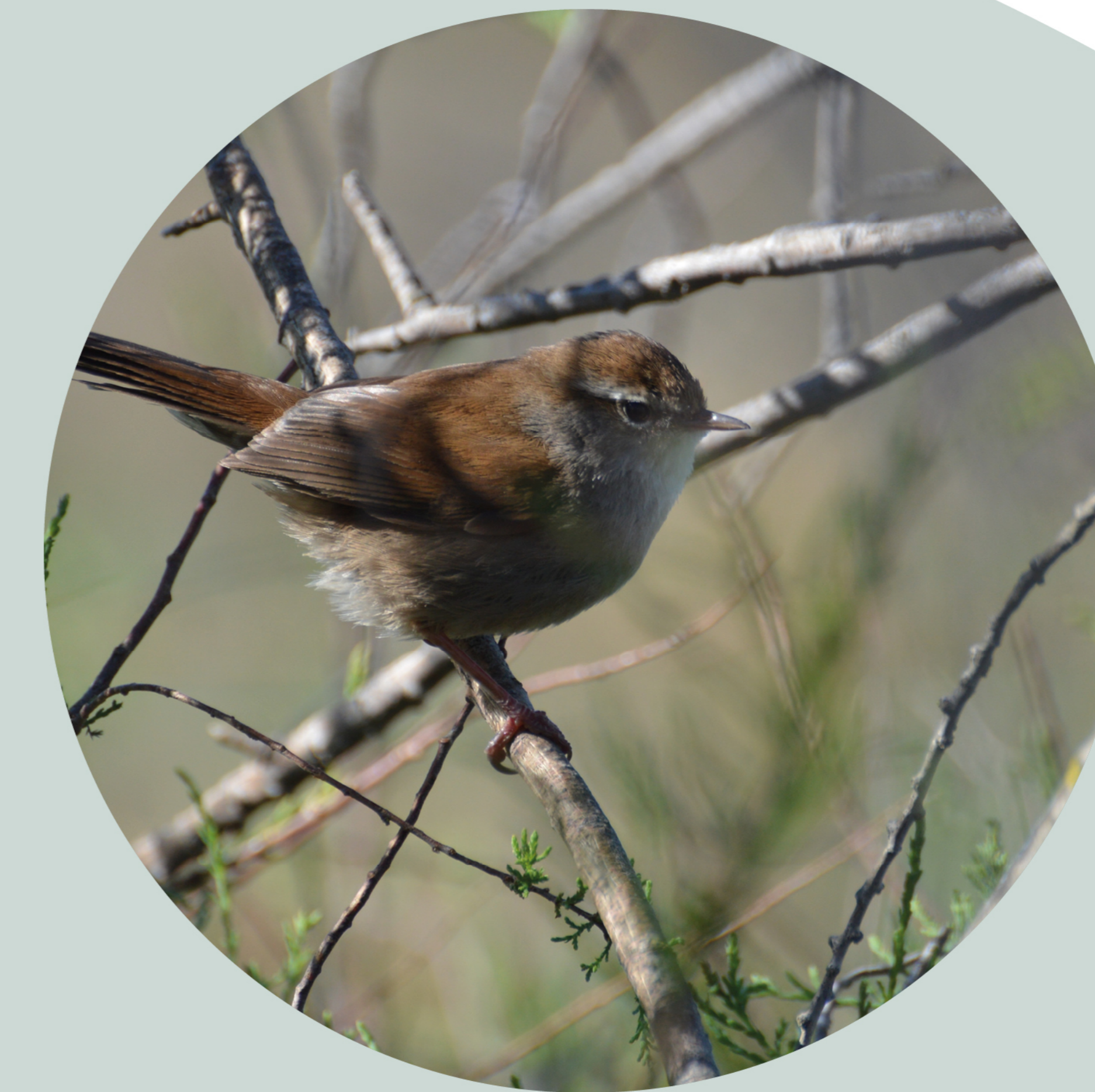
Bouscarle de Cetti Cettia cetti