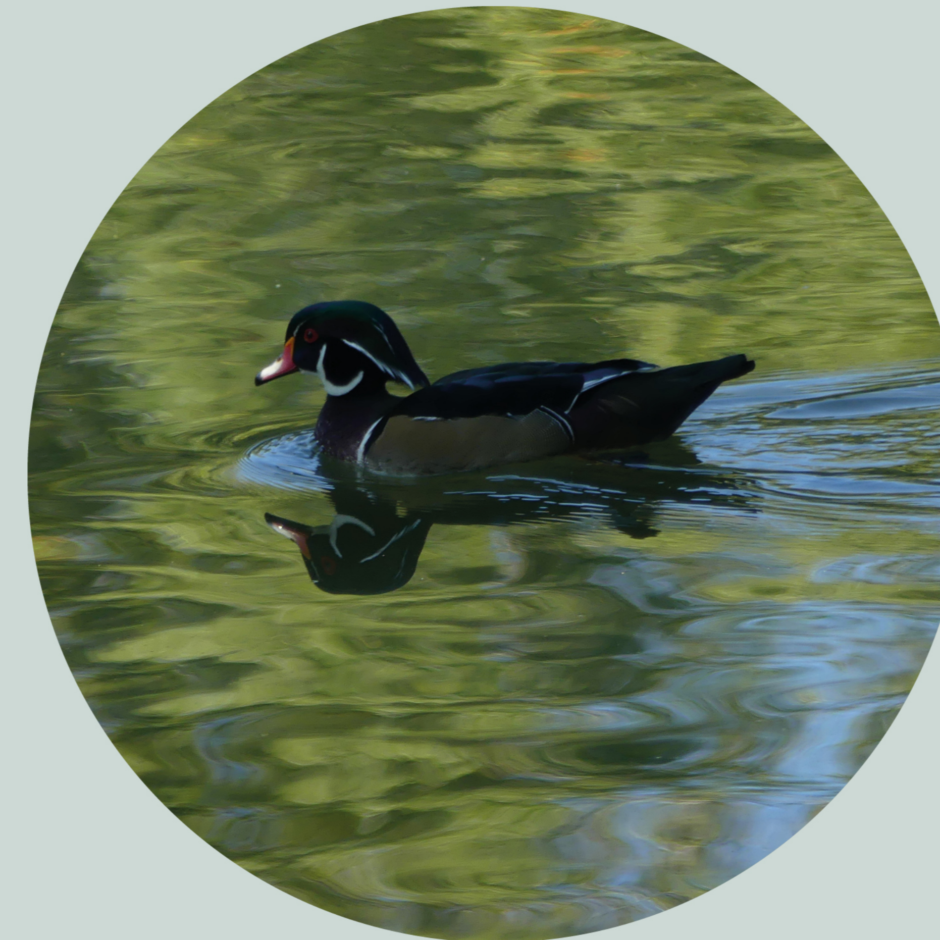
Canard carolin Aix sponsa