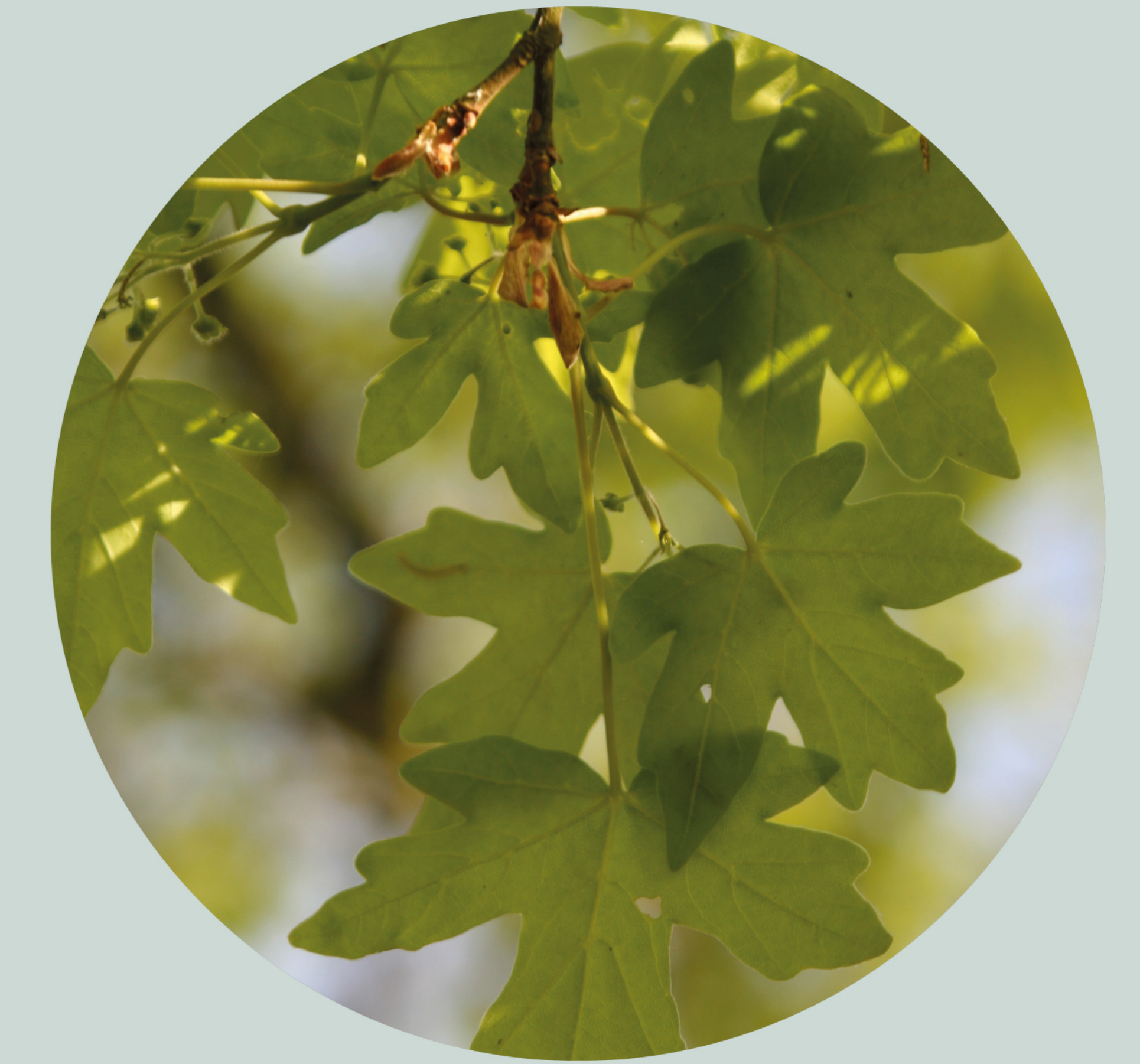
Érable champêtre Acer campestre