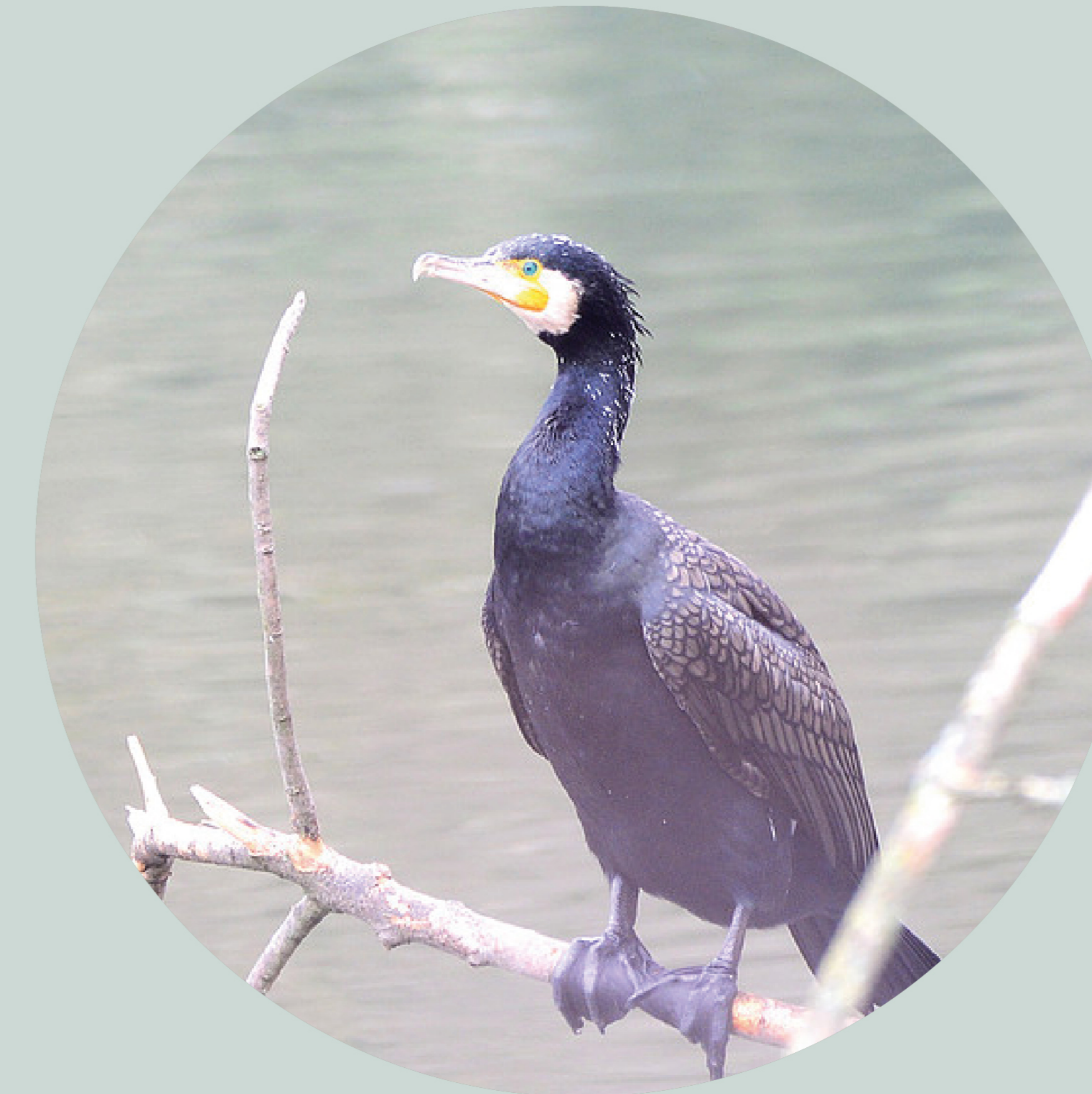
Grand cormoran Phalacrocorax carbo