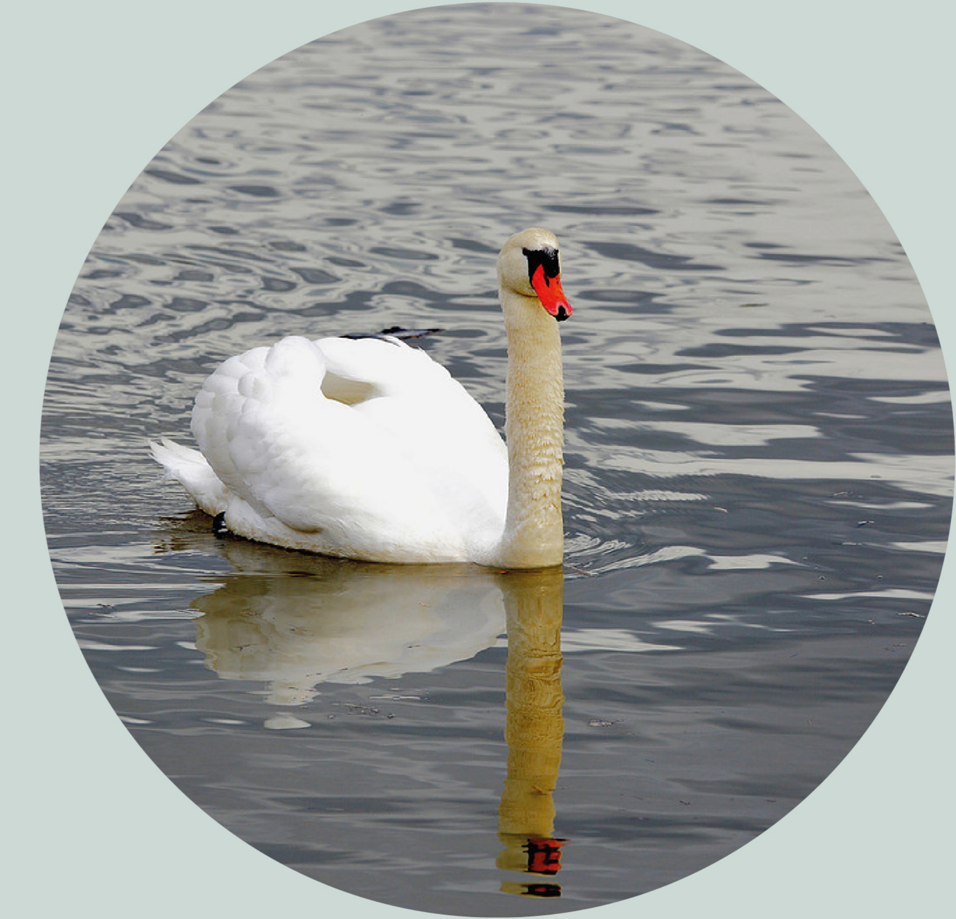
Cygne tuberculé Cygnus olor