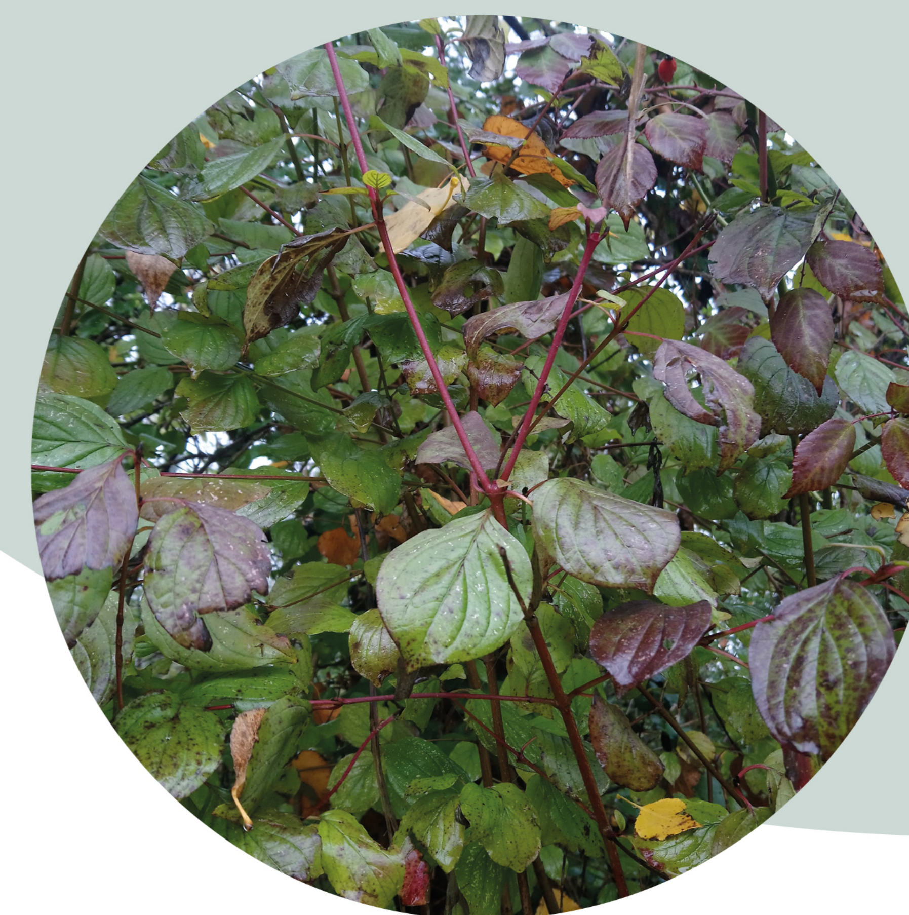
Cornouiller sanguin Cornus sanguinea