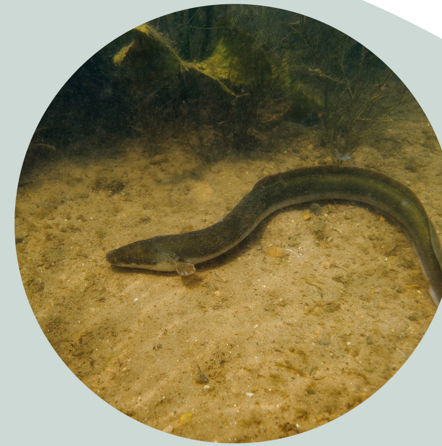
Anguille d'Europe Anguilla anguilla