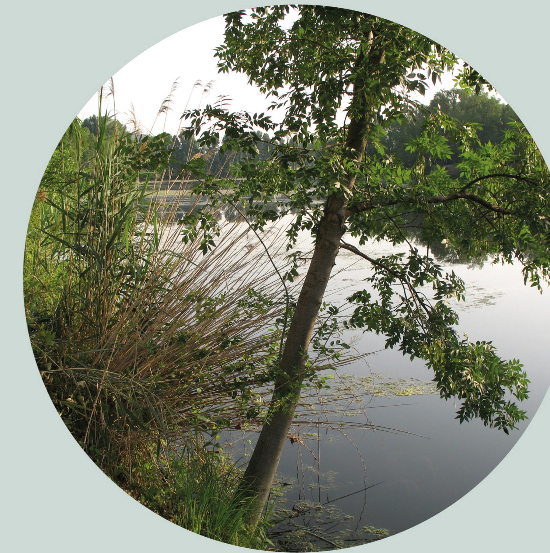
Frêne élevé Fraxinus excelsior