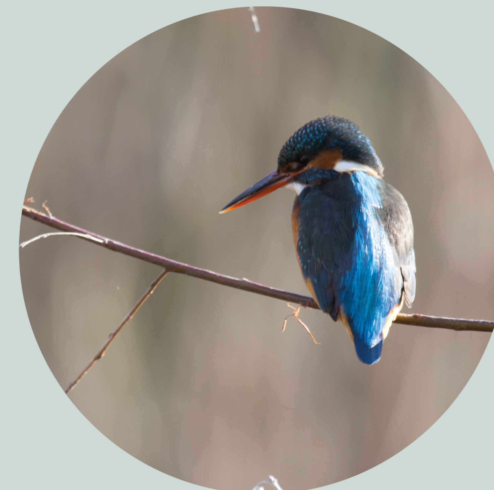
Martin pêcheur d'Europe Alcedo atthis