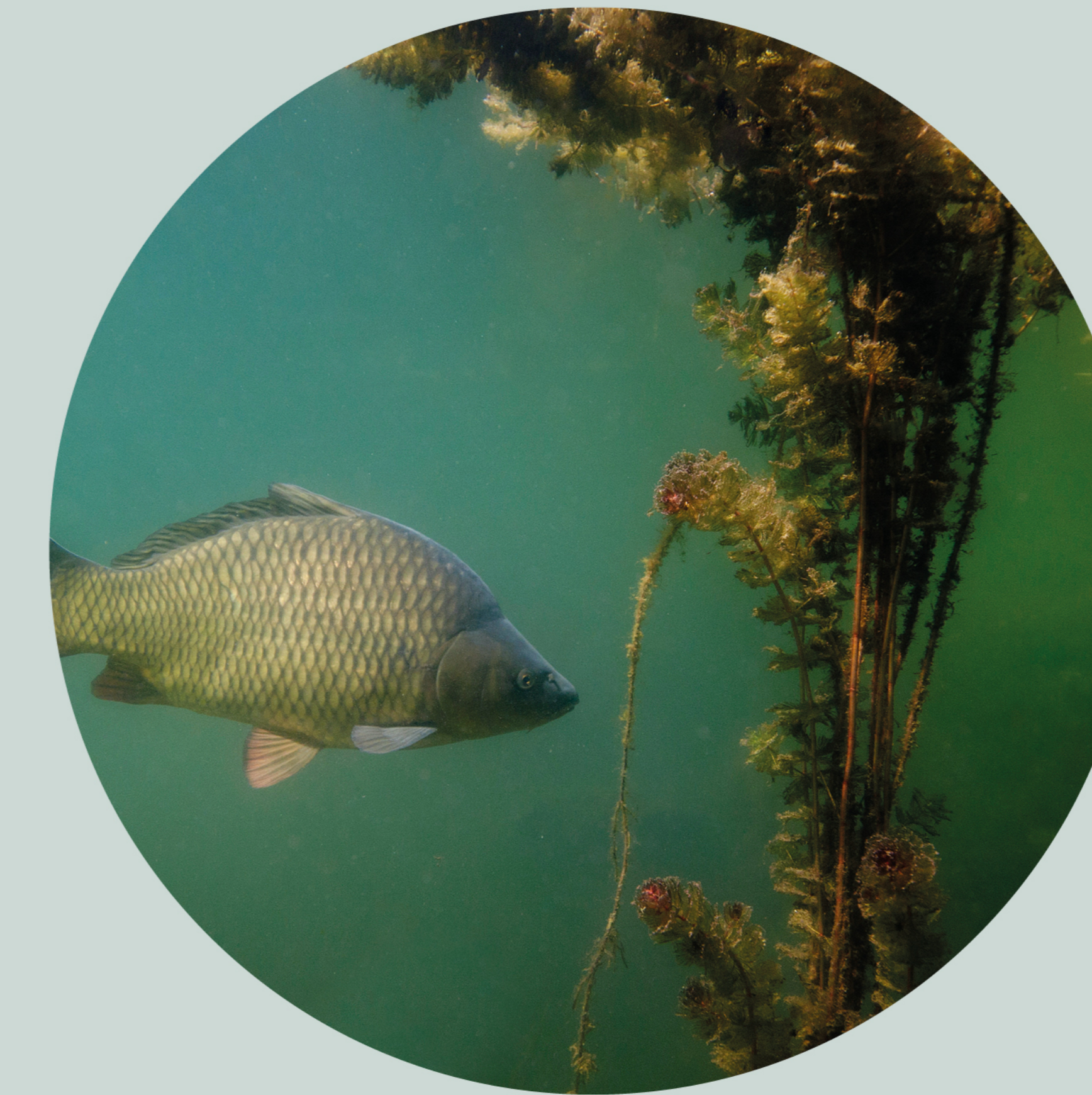
Carpe commune Cyprinus carpio