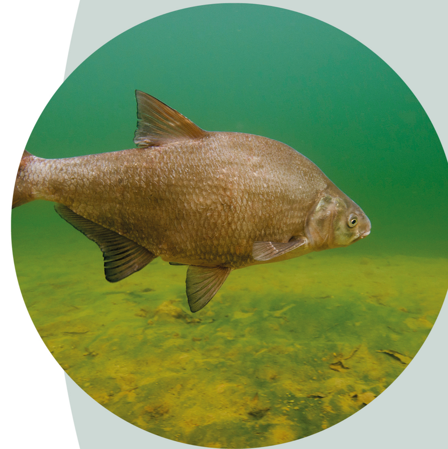
Brème commun Abramis brama