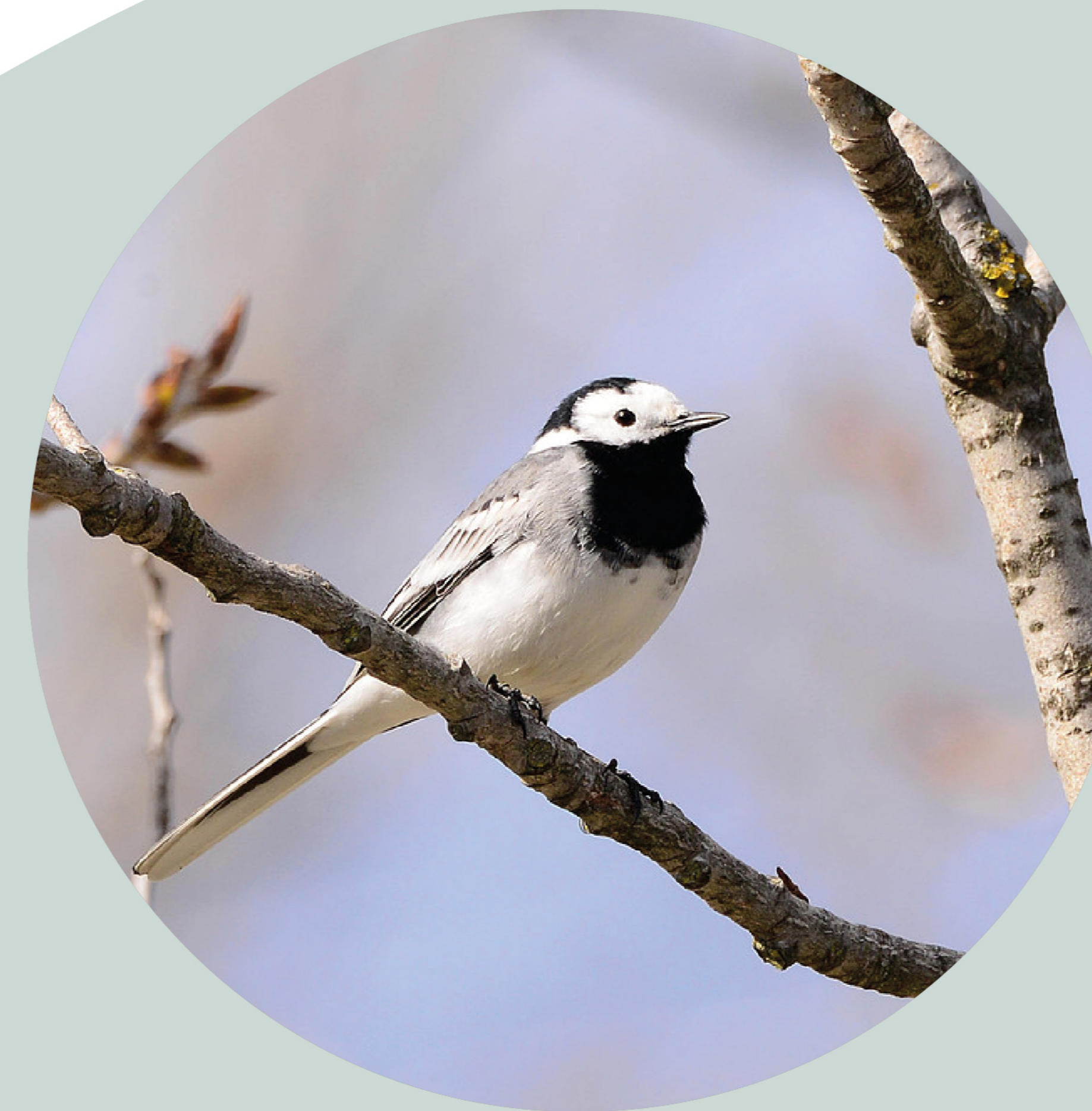
Bergeronnette grise Motocilla alba