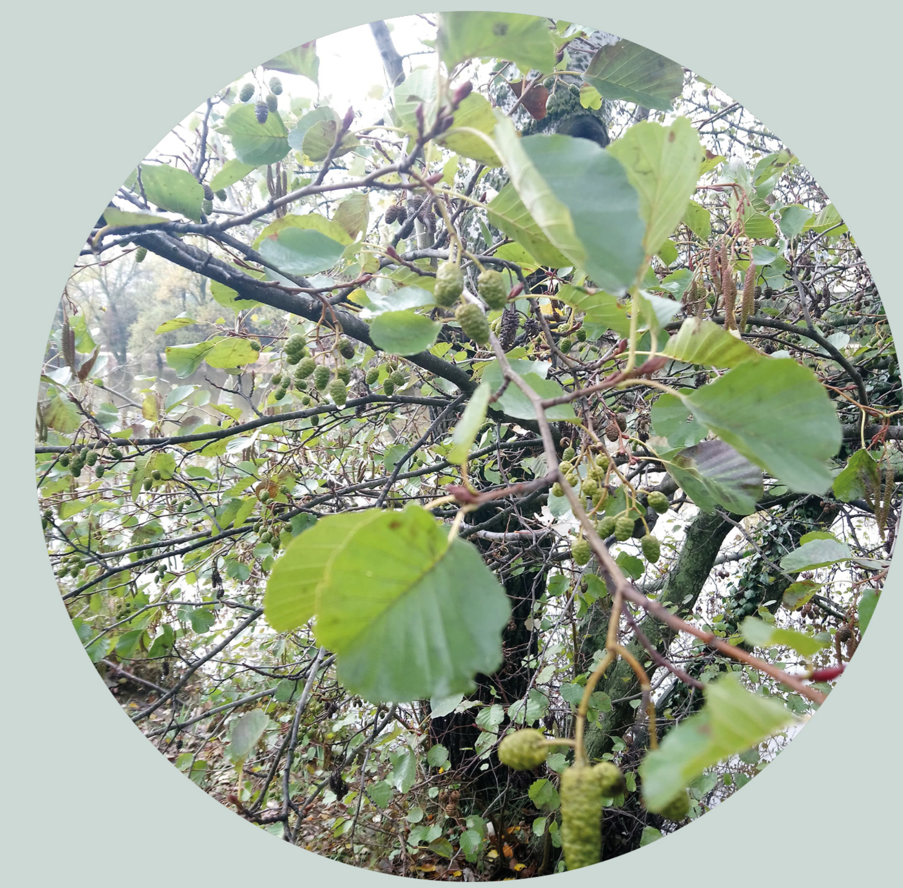
Orme champêtre Ulmus minor