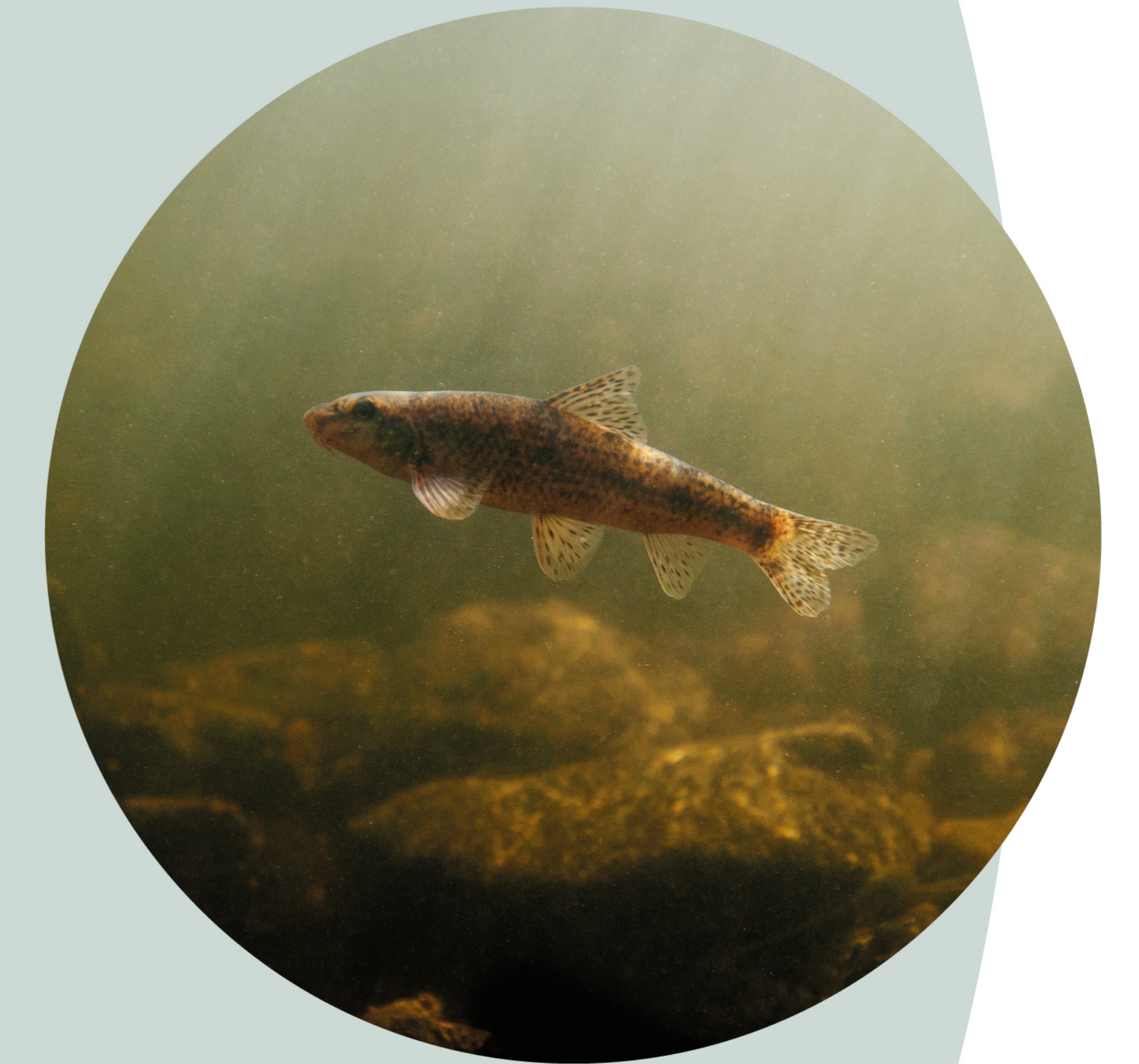
Goujon Gobio gobio