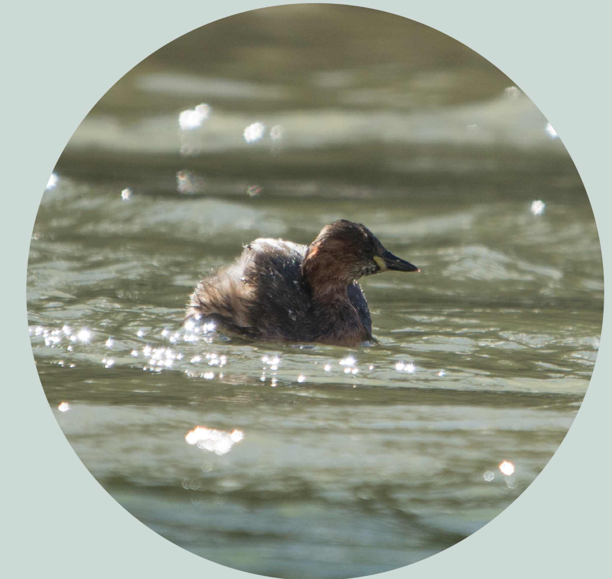
Grèbe castagneux Tachybaptus ruficollis