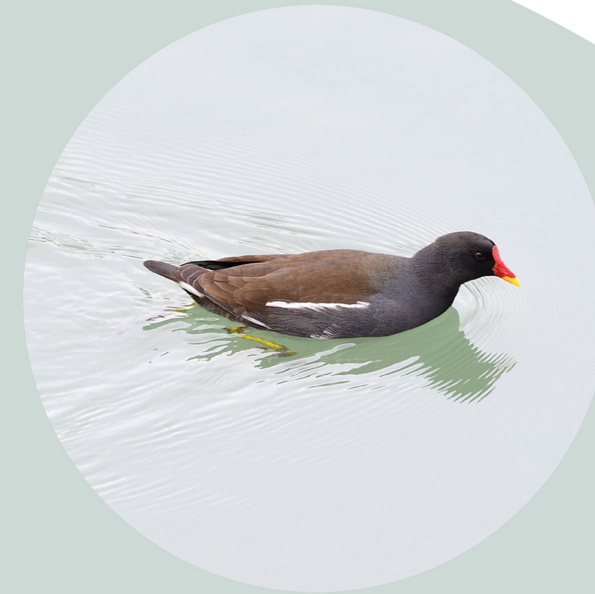
Gallinule poule-d'eau Gallinula chloropus