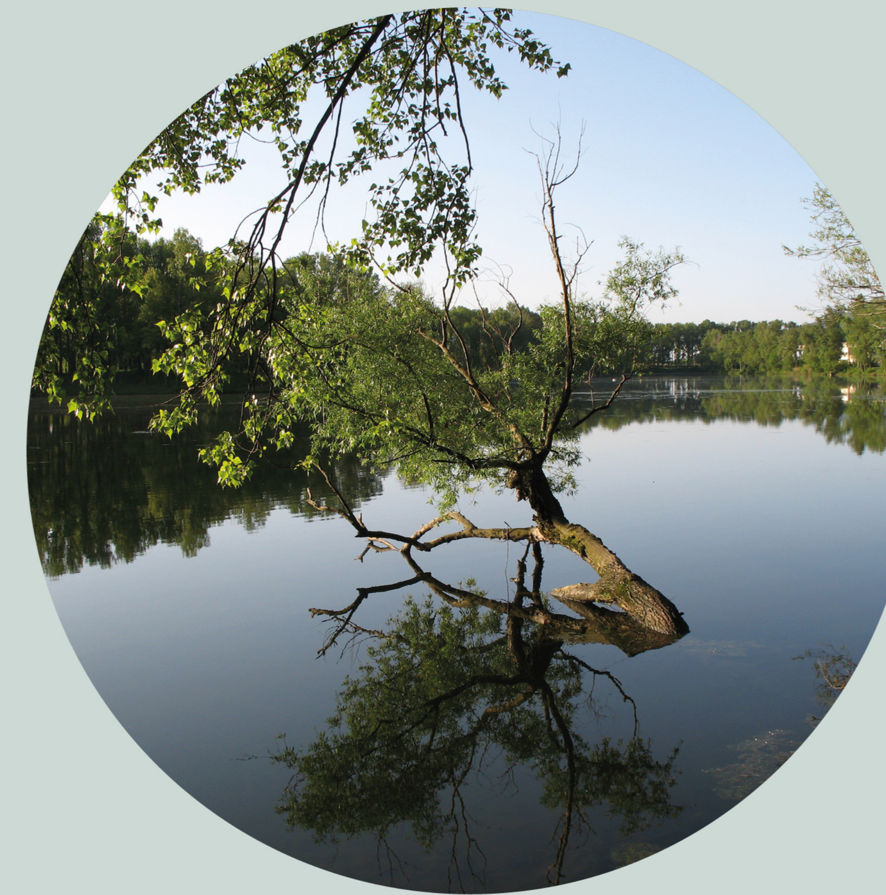
Saule blanc Salix alba