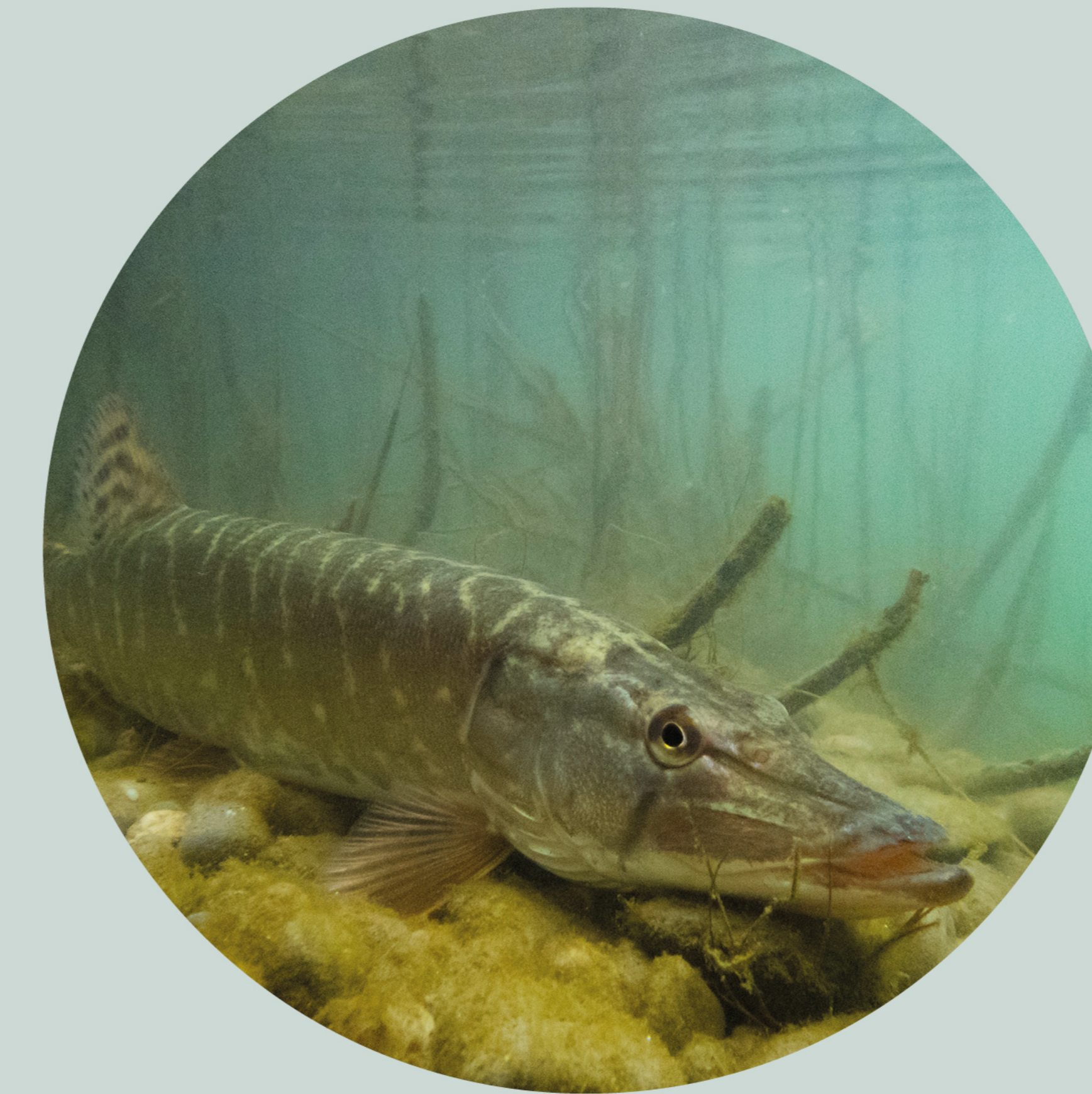
Brochet Esox lucius