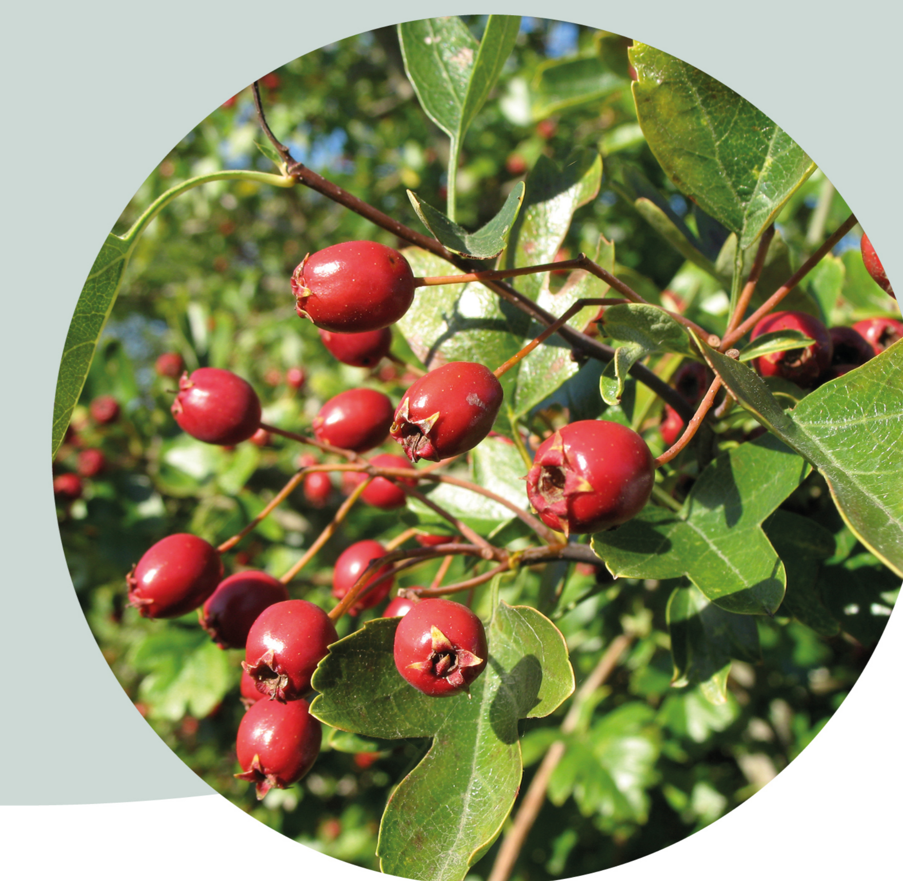
Aubépine monogyne Crataegus monogyna