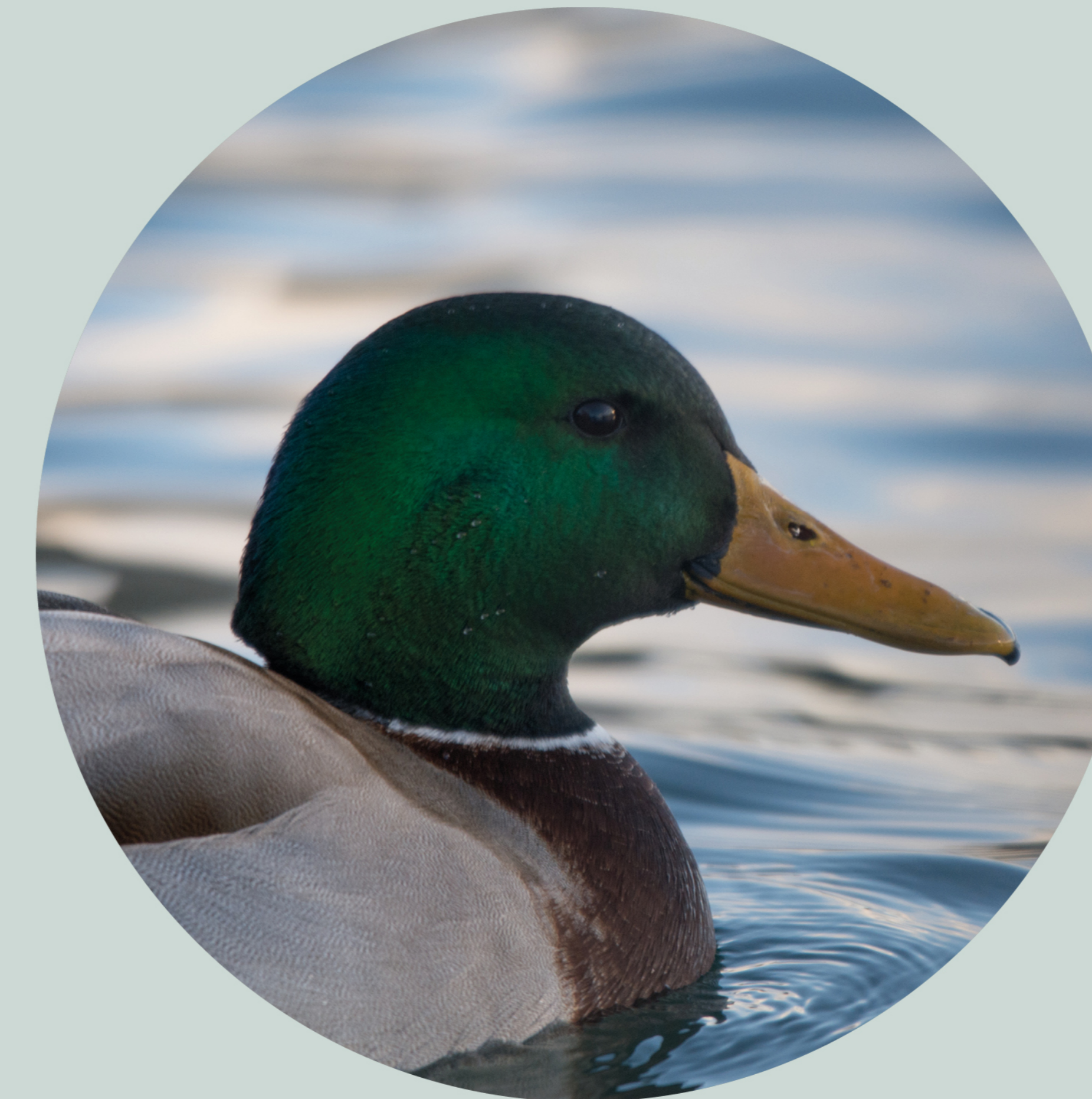
Canard colvert Anas platyrhynchos