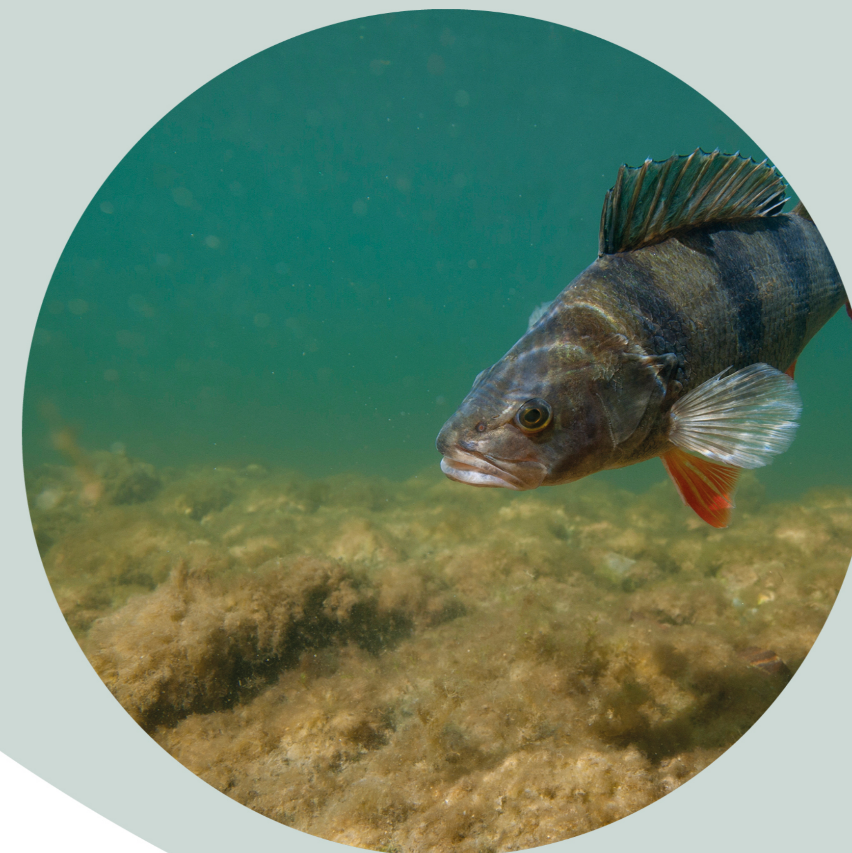
Perche commune Perca fluviatilis