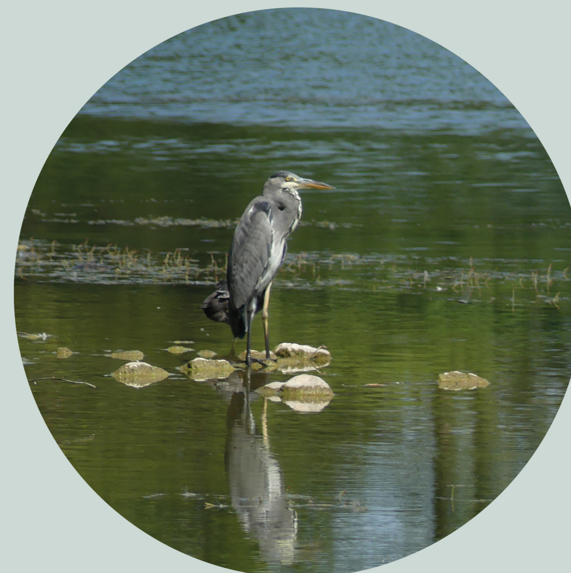
Héron cendré Ardea cinerea