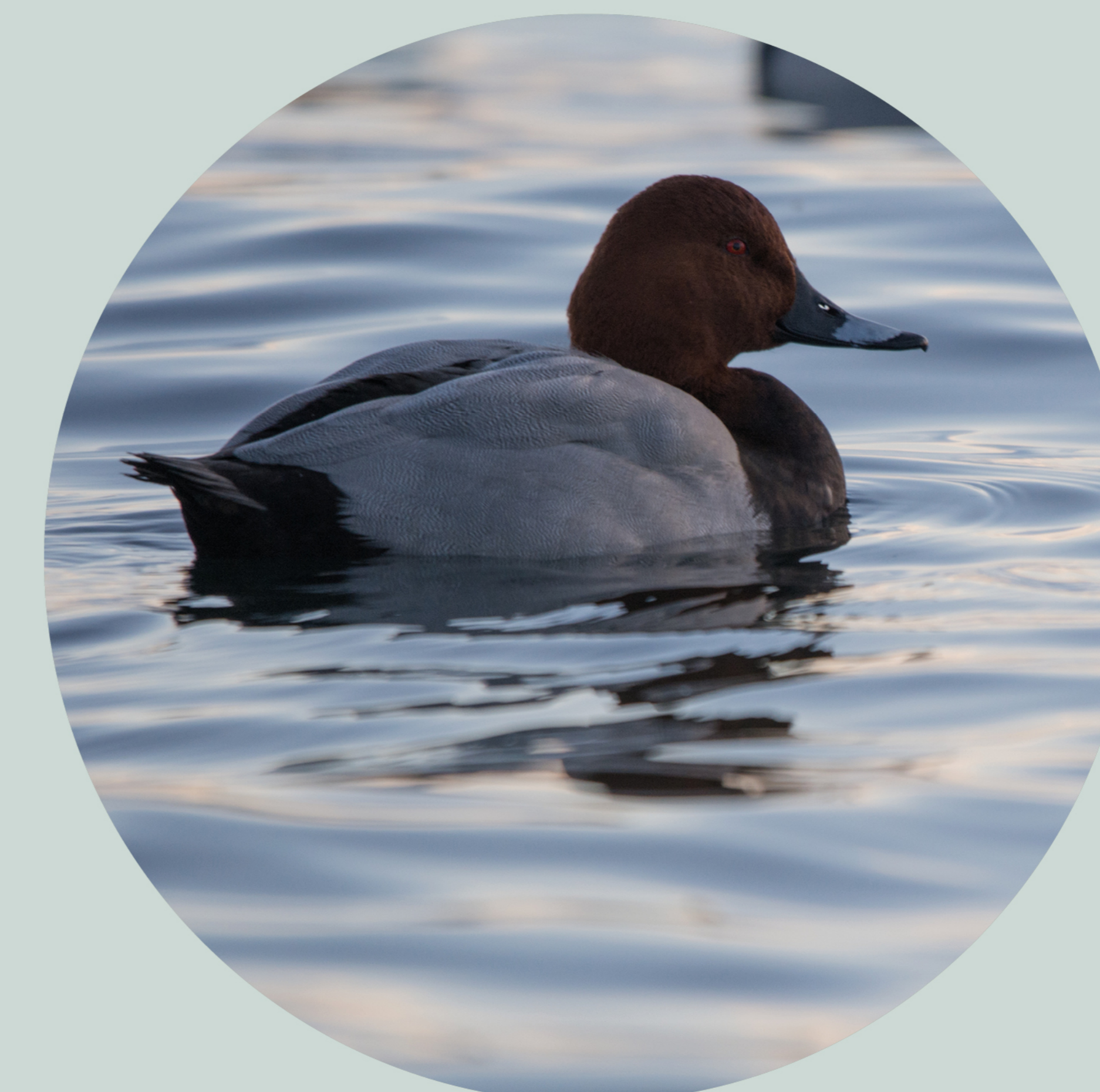
Fuligule milouin Aythya ferina