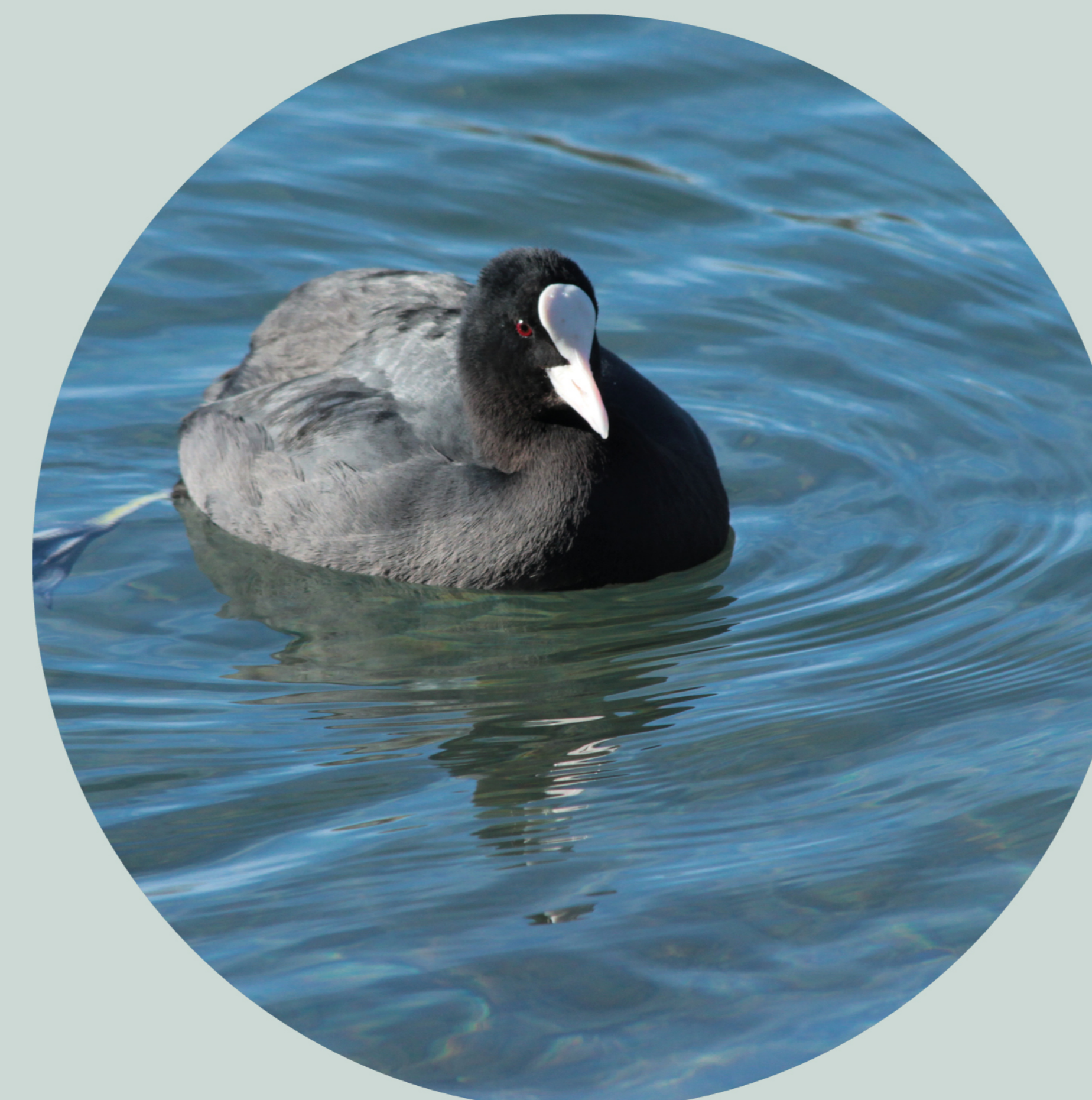
Foule macroule Fulica atra