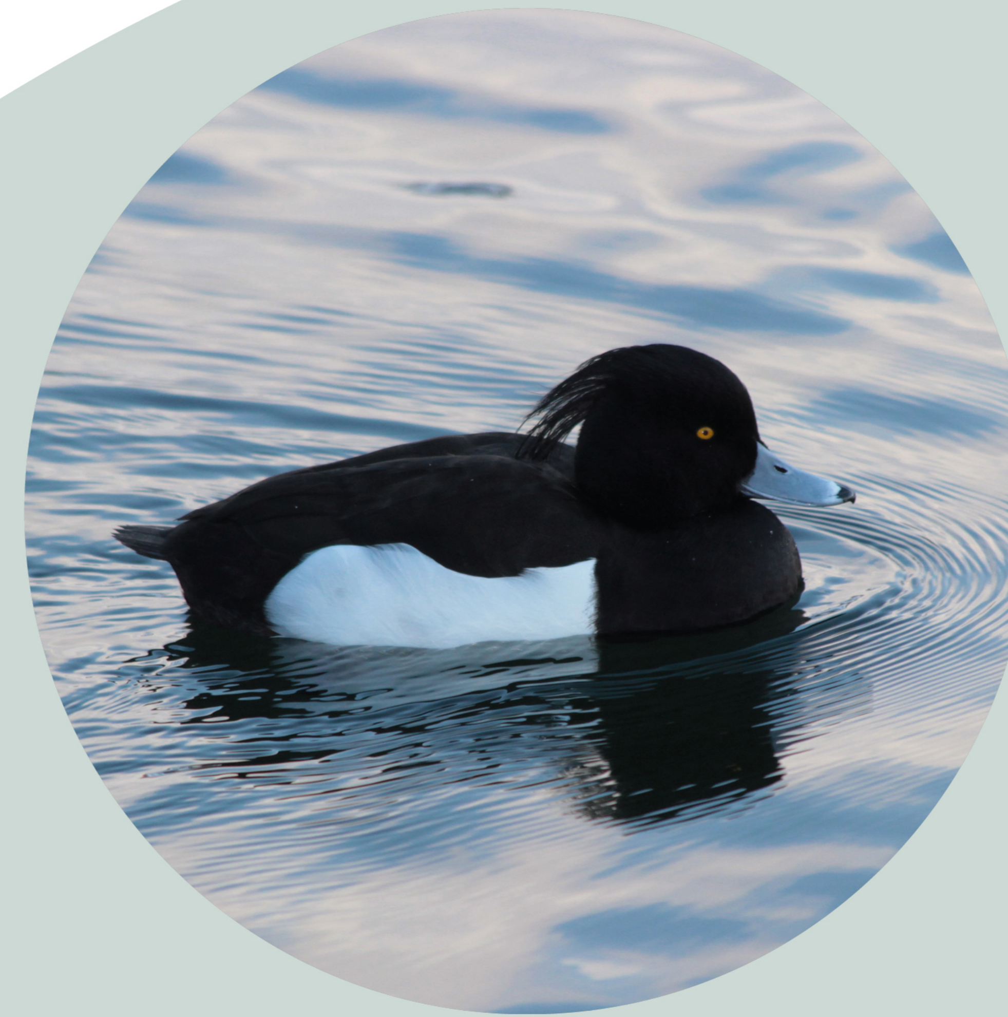
Fuligule Morillon Aythya fuligula