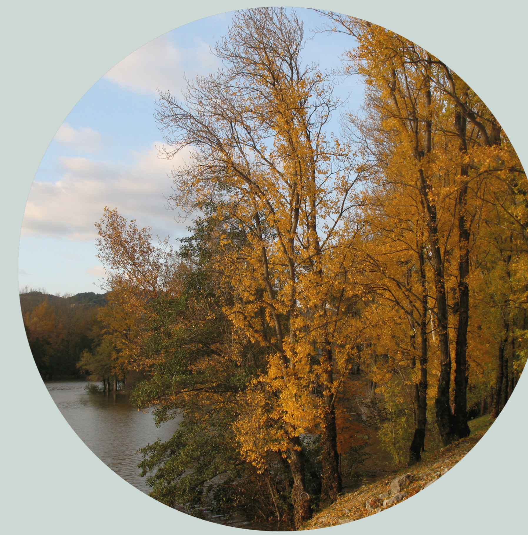
Peuplier noir Populus nigra