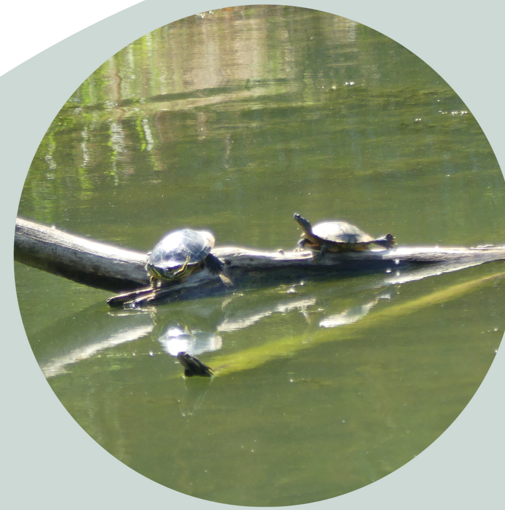
Tortue à tempes rouges ou de Floride Trachemys scripta elegans

Mais ils ne sont pas seuls, des tortues à tempes rouges ou tortues de Floride sont, elles aussi, présentes, abandonnées par des particuliers. Cette espèce, originaire d'Amérique du Nord, est considérée comme envahissante en Europe. Elle nuit à la bonne santé du lac et des autres espèces.